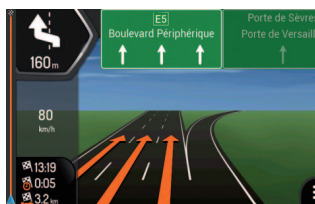
Schnell erfassbare Routenführung auch an unübersichtlichen Stellen