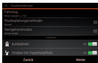
Berücksichtigung der spezifischen Fahrzeugdaten bei der Navigation