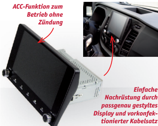
ESX Vision VNC940 passt perfekt ins Fahrzeugcockpit

bootet das System in Rekordgeschwindigkeit. Das verkürzt die Zugriffszeit auf das Gerät, zum Beispiel nach einem Tankstopp, erheblich. Der VNC940 zeigt eine flüssige und erstaunlich schnelle Bedienperformance. Weiterer Pluspunkt: Die Umschaltung auf die Rückfahrkamera funktioniert ungewöhnlich schnell. Im Campingalltag ist die ACC-Funktion sehr nützlich. Damit lässt sich der Naviceiver ohne eingeschaltete Zündung betreiben und alle Funktionen stehen am Stellplatz ganz einfach zur Verfügung.