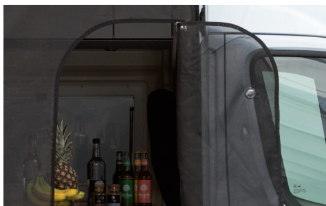
Clever gelöst: Ein extrem starker Magnet hält die integrierte Tür bei Bedarf offen

Die große Seitentür am Kastenwagen wird von Campern sehr geschätzt. Hier kommt viel Licht und Luft ins Fahrzeuginnere. Der Nachteil: Kleine Plagegeister finden die große Öffnung genauso toll. Mit dem HINDERMANN Insektenschutzvorhang für die Schiebetür des Fiat Ducato X250/290 und baugleiche Fahrzeuge mit Eurochassis ist der Weg, selbst für kleine Fliegen, im Handumdrehen versperrt. Ein Insektenschutz ist erst dann wirklich perfekt, wenn er die komplette Öffnung abdeckt. Den HINDERMANN Insektenschutzvorhang gibt es in zwei Versionen, die sich in der Höhe des Türausschnittes unterscheiden. Bei der Ent-