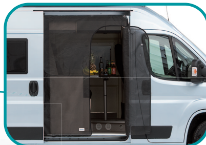
Große Tür, die den schnellen Zugang zum Fahrzeug ermöglicht, ohne den ganzen Vorhang zu öffnen

Der Schutzvorhang besteht aus dem gleichen engmaschigen Polyestergerewebe wie der Insektenschutzvorhang für den Heckbereich. Damit ist eine sehr gute Sicht nach außen und gute Luftzirkulation garantiert.