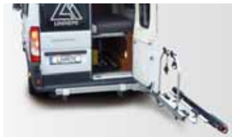
SCHNELL AN DEN STAURAUUM Der GiroVan lässt sich – beladen oder unbeladen – einfach zur Seite klappen