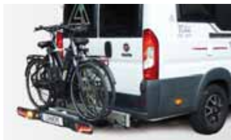
EINFACH BELADEN E-Bikes lassen sich einfach auf Kniehöhe auf den Träger laden