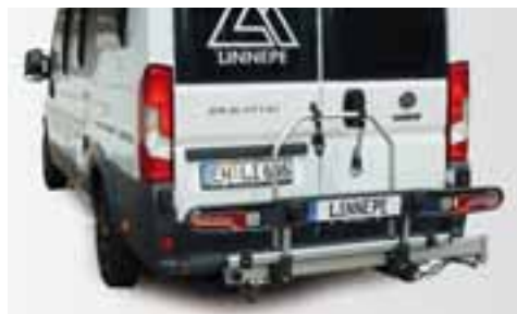
KOMPAKT BEI NICHTGEBRAUCH Wird der Träger nicht genutzt, dann lässt er sich platzsparend hochklappen – oder einfach komplett abnehmen

forderlich – eine Kombination mit einer Kupplung mit abnehmbarem Kugelkopf aber möglich. Ist der E-Bike-Träger nicht beladen, lässt er sich werkzeuglos hochklappen. Dadurch wird das Fahrzeug circa 40 Zentimeter kürzer. Wird er einmal nicht gebraucht, lässt er sich, ebenfalls werkzeuglos, mit wenigen Handgriffen abnehmen.